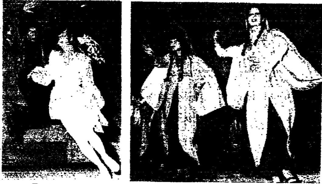
رطل السباح من نيات امية

كان يتبول بين المشاعين ، حالي التميم ، اسر طون البيل ، وانتا كشت ، تشبه لحنه البعباب